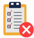
Berkas Tidak Lengkap