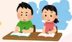
Mengisi buku tamu & mrngambil no antrian