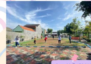
Lap. Volly RW X