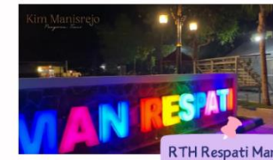
RTH Respati Manis