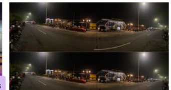
Lapak Pagu Indah